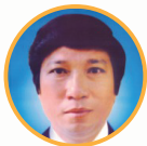
ĐẠI HỘI ĐẠI BIỂU ĐOÀN TOÀN QUỐC LẦN THỨ SÁU