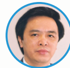
ĐẠI HỘI ĐẠI BIỂU ĐOÀN TOÀN QUỐC LẦN THỨ TÁM