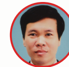
ĐẠI HỘI ĐẠI BIỂU ĐOÀN TOÀN QUỐC LẦN THỨ CHÍN