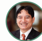
ĐẠI HỘI ĐẠI BIỂU ĐOÀN TOÀN QUỐC LẦN THỨ MƯỜI