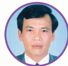
ĐẠI HỘI ĐẠI BIỂU ĐOÀN TOÀN QUỐC LẦN THỨ BẢY